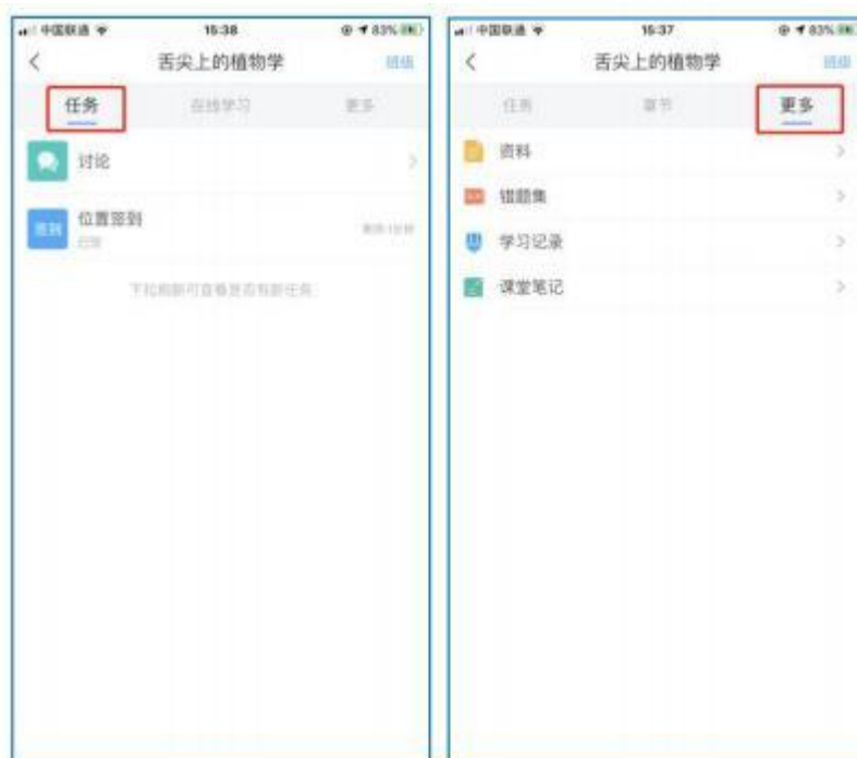
移动端课程任务及更多

此外，点击“任务”，可查看老师发放的学习任务及各类通知，点击“更多”可查看老师准备的学习资料和这门课程的个人错题集。