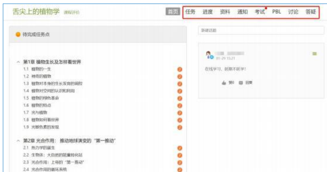
图 7 进行课程学习