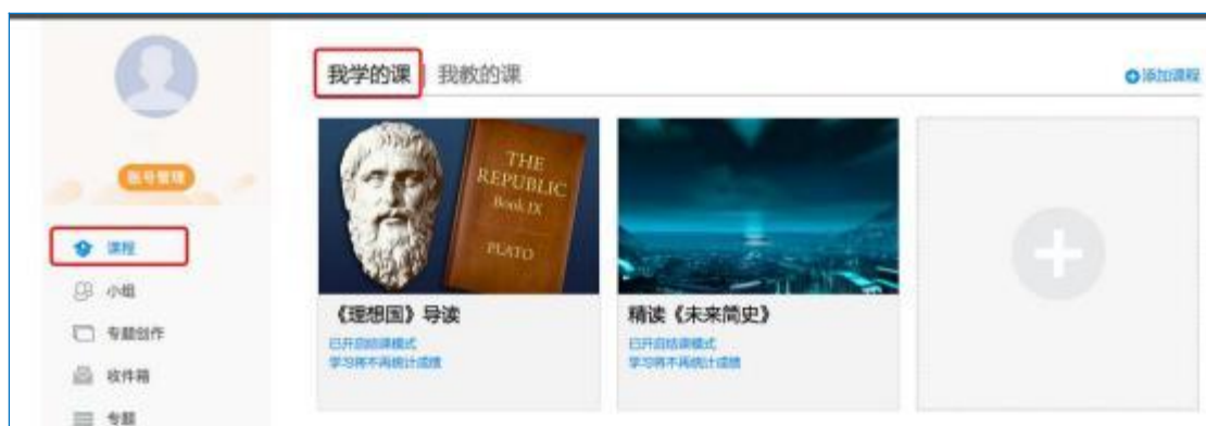
图 6 点击进入课程

进入课程后，可查看章节列表的知识点，右上角为学习导航，可即时收到老师发布的学习任务、测验、作业及考试，查看自己的学习进度，并进行资料中的